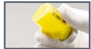
Suspension: pas de grumeaux

! Si de la mousse apparaît : laisser reposer le flacon jusqu'à disparition