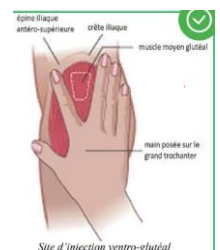
Site d'injection ventro-glutéal