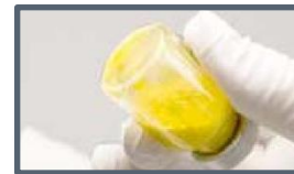
Pas de suspension: grumeaux visibles